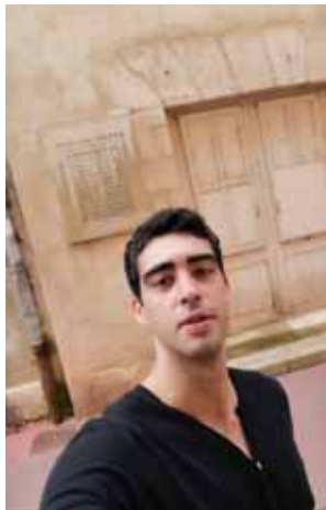
MAISON DE NÉCIPHORE NIÈPCE